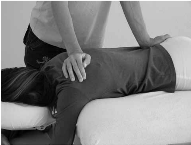
Freies Fließen der Energie als Ziel: Mit verschiedenen Dehn-, Druck- und Mobilisierungstechniken lösen Polarity-TherapeutInnen Blockaden.