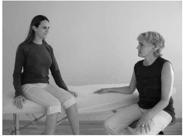
Körper, Geist und Seele: Mit Hilfe prozessbegleitender Gespräche werden die Erfahrungen aus der Therapie in den Alltag integriert.

Prozess der Klärung und Gesundung. Fragen wie: »Wovon ernähre ich meinen Körper? Wovon ernähre ich meinen Geist? Welche Gefühle machen mich satt?« sind Teile dieses Konzeptes. Auch beim Yoga kommt es früher oder später unweigerlich zu einer bewussteren Nahrungsaufnahme. SchülerInnen werden durch den tief gehenden Kontakt zu sich, ihrem Körper (innere Achtsamkeit) bezüglich ihrer Bedürfnisse und Empfindungen sensibilisiert und erfahren so, was ihnen gut tut, was sie nährt und was sie träge oder müde macht.