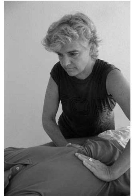
Bitte einmal langsam Luft holen: Auch im Polarity wird viel mit der Atmung gearbeitet.

und Selbstschau auch zu einer Sensibilisierung der Sinne für unser Umfeld. Konsum, Menschenrechte, Tierschutz, Ernährung, Umweltschutz, Frieden, Nächstenliebe, etc. werden mehr und mehr integriert. Wir praktizieren Yoga nicht nur für uns, sondern tauchen dabei ein in eine Welt der Achtsamkeit und stärken durch unser Handeln ein friedliches Weltbild.