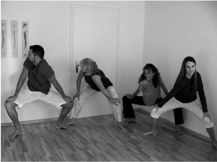
Im klassischen Haṭha-Yoga eher unbekannt: Die Pyramide hilft, die Wirbelsäule beweglicher zu machen.